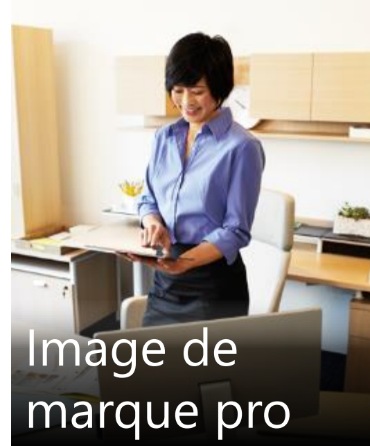
Image de marque pro

Partagez les informations avec vos clients et partenaires